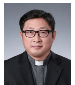
이영춘 사도 요한 신부 (호남교회사연구소)

현재 평화의 전당에서는 103위 성인화전이 진행되고 있습니다. 하느님을 “아버지”로 고백했던 성인들의 믿음에 찬 얼굴을 마주 보며 우리 마음에도 굳건한 믿음의 성화가 한 폭 그려졌으면 좋겠습니다. 또한 최근 우리 교구는 한국 최초 순교자들의 묘소와 유해를 발견하는 벅찬 기쁨을 누리게 되었습니다. 그 기쁨과 함께 하느님께서 그 일과 복자들을 통해 우리에게 주신 신앙의 사명을 깊이 묵상해야 하겠습니다.