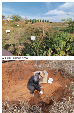
사진으로 보는 복자 윤지충 바오로, 권상연 야고보, 윤지현 프란치스코의 유해 발굴 이장업체 작업 및 교구 현장 수습 조사